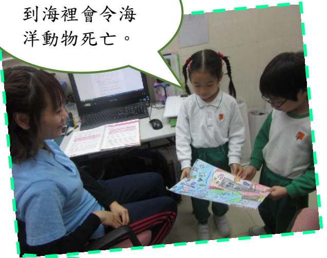
人類把垃圾丟到海裡會令海洋動物死亡。