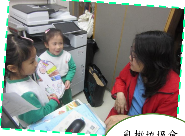
亂拋垃圾會令地球先生生病。