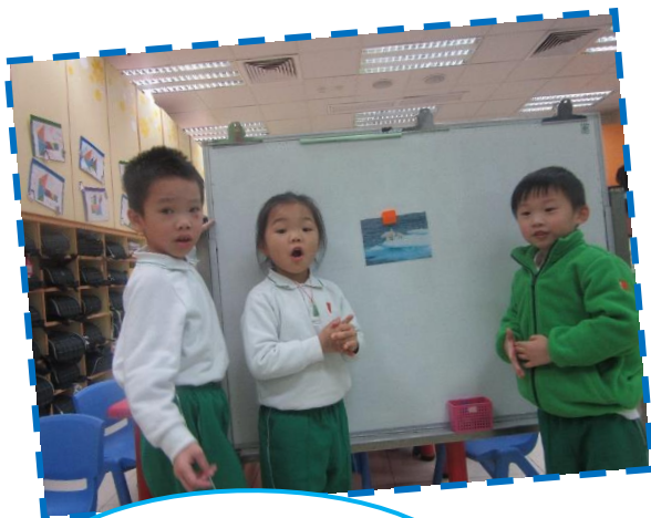
汽車排出的廢氣令空氣變差!