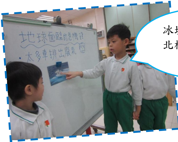
冰塊開始溶化，北極熊快沒地方居住了。