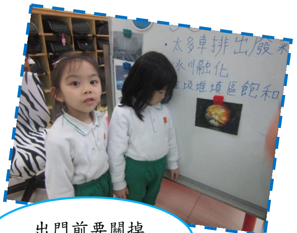
出門前要關掉所有電器!