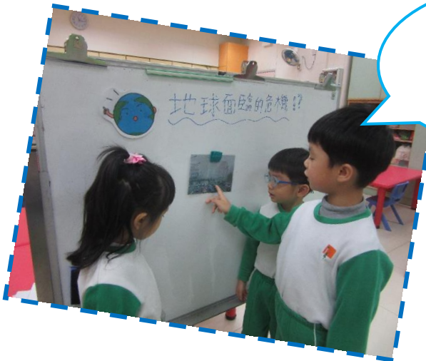
我們可以乘搭公共交通工具代替私家車。