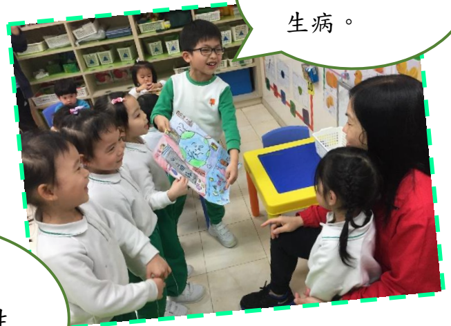
人人保護環境，地球先生便感到開心。