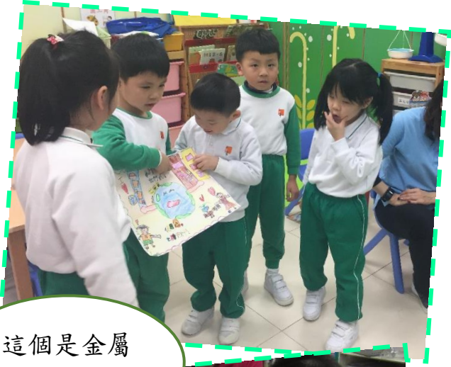
這個是金屬回收箱。